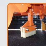
Mittlerer Gleitkufen mit Gummifuß