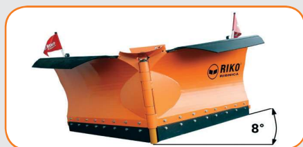
Seitenanpassung des Pfluges bis zu 8°. Den Ausgleich reguliert die Blattfeder