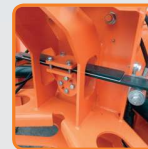
Blattfeder (Ausgleich von Seitenneigung des Pfluges)