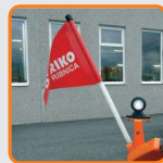
Begrenzungsleuchten mit Warnflaggen