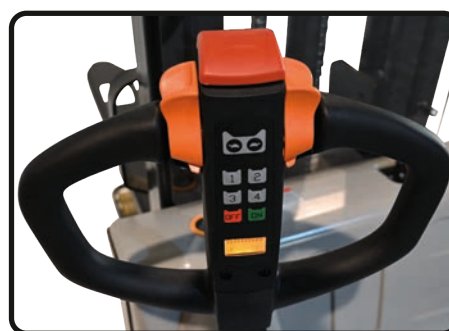
Samtliga modeller utrustade med pinkodslås.