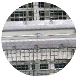
Außensiebbespannung wahlweise 2 - 80 mm