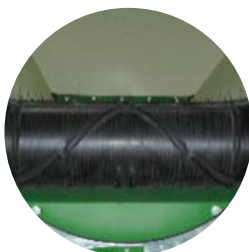
Profilgurt für Bandaufgeber