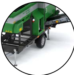
Einfachachse (zulässige Anhängelast des Zugfahrzeugs 1,8t)