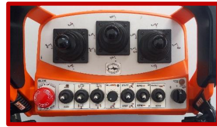
1A- Télécommande sans fil non proportionnelle