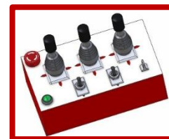
Commande électrique filaire de type joystick