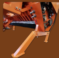
Pogon preko kardanske gredi (PTO).