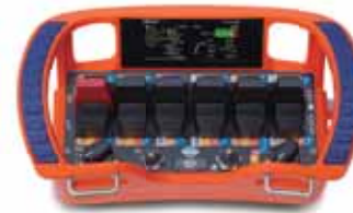
• Proportionale Funkfernsteuerung