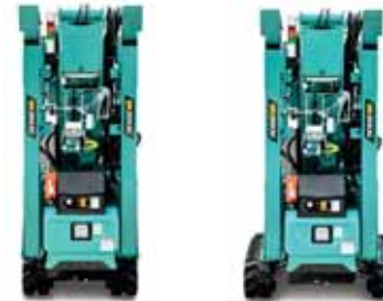
• Variabel verstellbares Fahrwerk