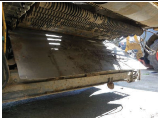
Unterboden, Anschluß für Erbunker