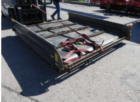
Erbunker (nicht angebaut)