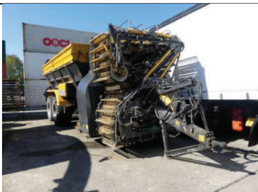
Ansicht vorne recht