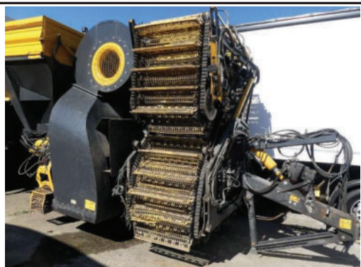
Ansicht Förderband, Gebläse Separator