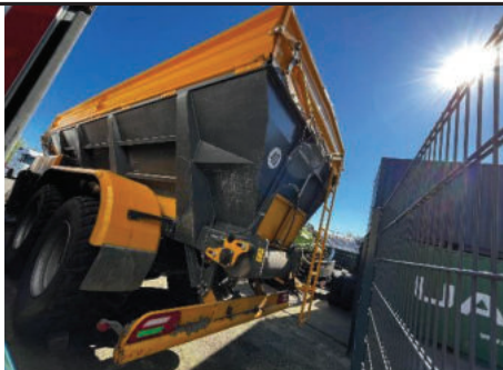
Ansicht hinten links